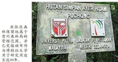
亚依淡森林保留地属于雪州森林局的管辖范围, 并已完报颁布作为博特拉大学用于研究用途长达99年。