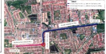
■莲花1/2路: 11月12日-11月26日 (2星期)