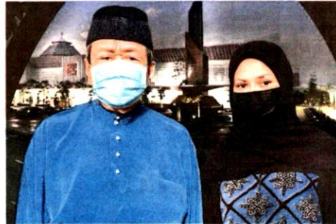
Sultan Sharafuddin Idris Shah bersama Tengku Permaisuri Norashikin dalam titah sempena sambutan Maal Hijrah, semalam.