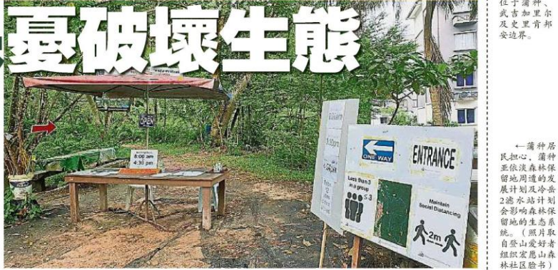
↑亚依淡森林保留地, 面积位于蒲种、武吉加里尔及史里肯邦安边界。