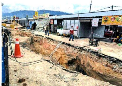
■为食街的地下水管工程在1月尾已率先施工。

稳定后, 4月进行重铺。为食街自今年1月尾开始动工, 原本的施工时间是晚上10时至清晨8时, 后来为食街的小贩们听取承包商汇报后, 同意让承包商全天候24小时施工, 工程在3月尾完工。