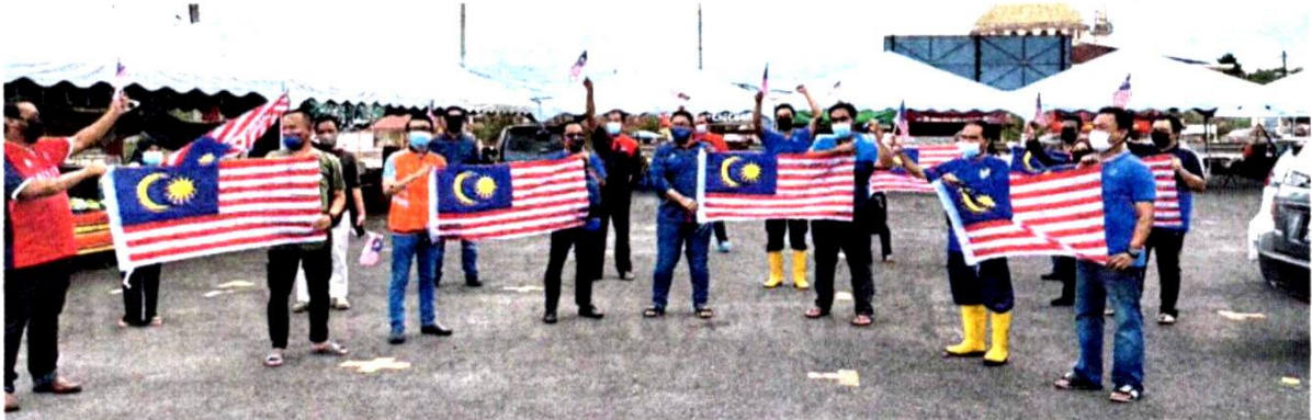
PENIAGA di Pasar Nelayan, LKIM. Kampung Pulau Meranti bersama Jalur Gemilang diagihkan Pusat Khidmat Masyarakat Dun Dengkil.