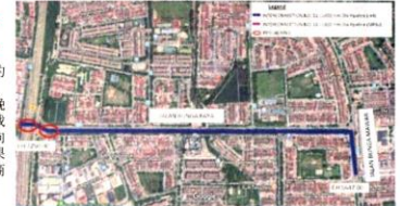
■布雅玛华路: 8月19日-9月4日 (2星期), 布雅拉也路: 9月5日-12月9日 (3个月)