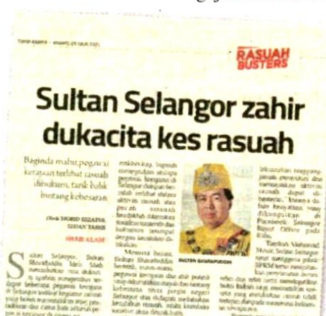
Keratan akhbar Sinar Harian pada 29 Julai 2021.

“S a y a gesa pihak pendak w a r a y a m e n e r u s k a n usaha dalam proses perundangan dan mendak w a