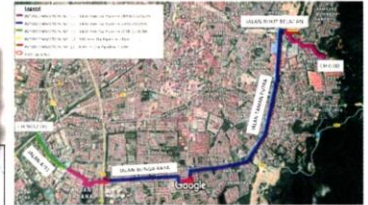
■丽华镇路: 8月11日-11月12日 (3个月)