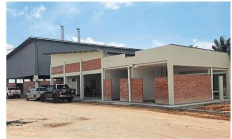
The cremation fee at the Sepang crematorium is fixed at RM200.

The crematorium is open daily from 8am to 5pm. It is located at Jalan Kelab Pekan Sepang in Kubur Bersepadu.